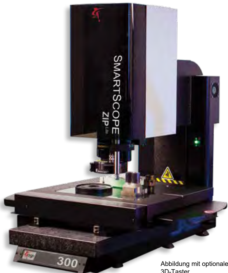
Abbildung mit optionalem 3D-Taster