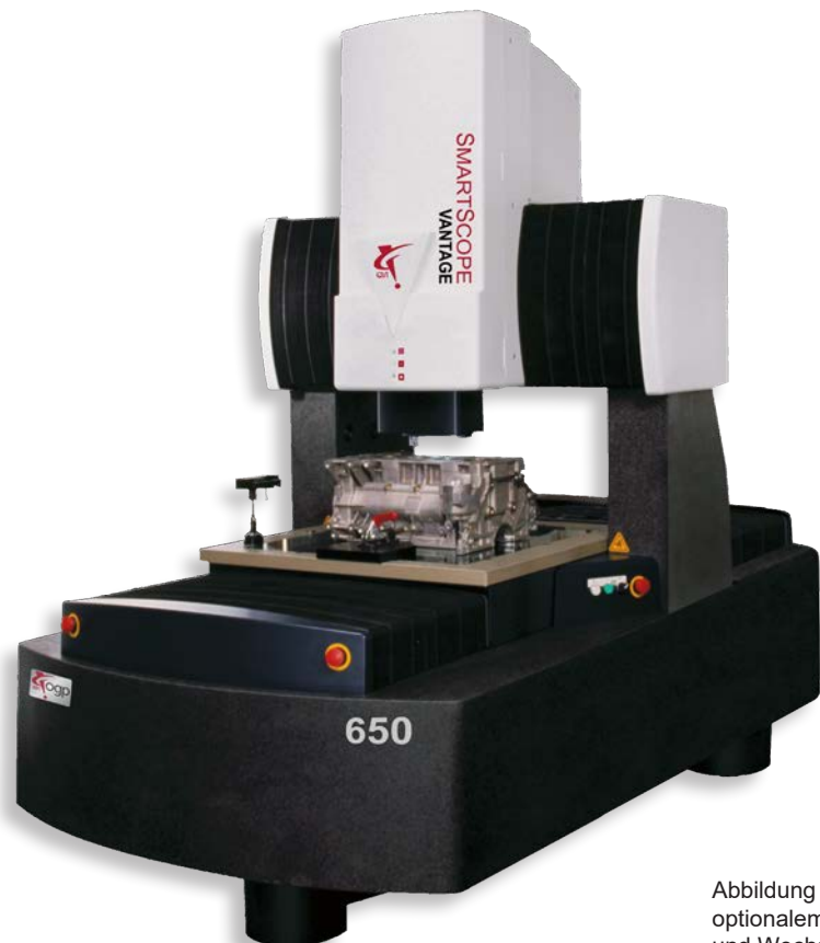
Abbildung mit optionalem Taster und Wechselbank